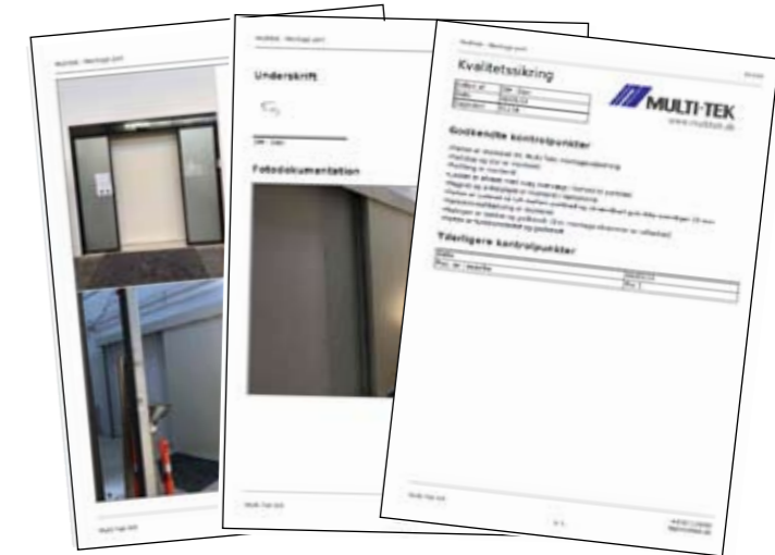
Kvalitetssikring med billedokumentation ved montage

Med andre ord kan vi bistå med alt fra projektet udvikles til produkterne monteres i bygningen og er klar til mange års fremtidig brug.